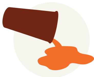
Water, wijn of olie morsen