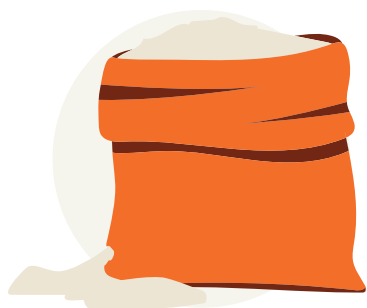
Zak bloem met een gat in

Romeinen geloofden dat het geluk bracht om te wrijven over munten. Sommige munten brachten meer geluk omdat er een bepaalde persoon, god of symbool op afgebeeld stond.